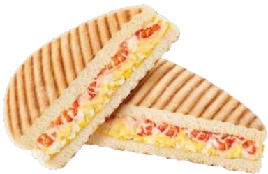
小龍蝦蛋沙律意式飽