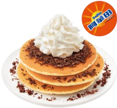
阿華田脆脆熱香餅