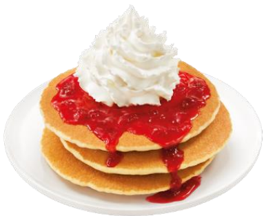
士多啤梨醬熱香餅