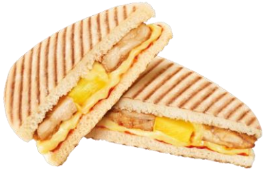
全新菠蘿雞肉意式飽