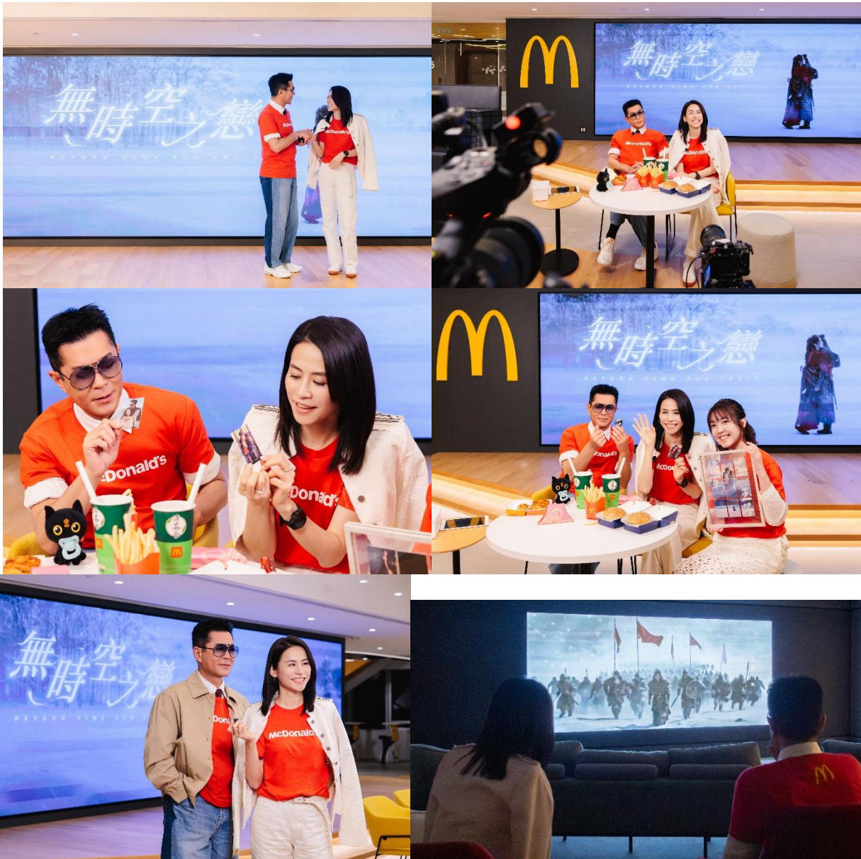
標題：為隆重其事，古天樂及宣萱更於昨晚（4月26日）親臨香港麥當勞辦公室，一同與粉絲齊齊Live住睇《無時空之戀》MV首播，即場與網民互動傾計，分享拍攝意念及趣事。