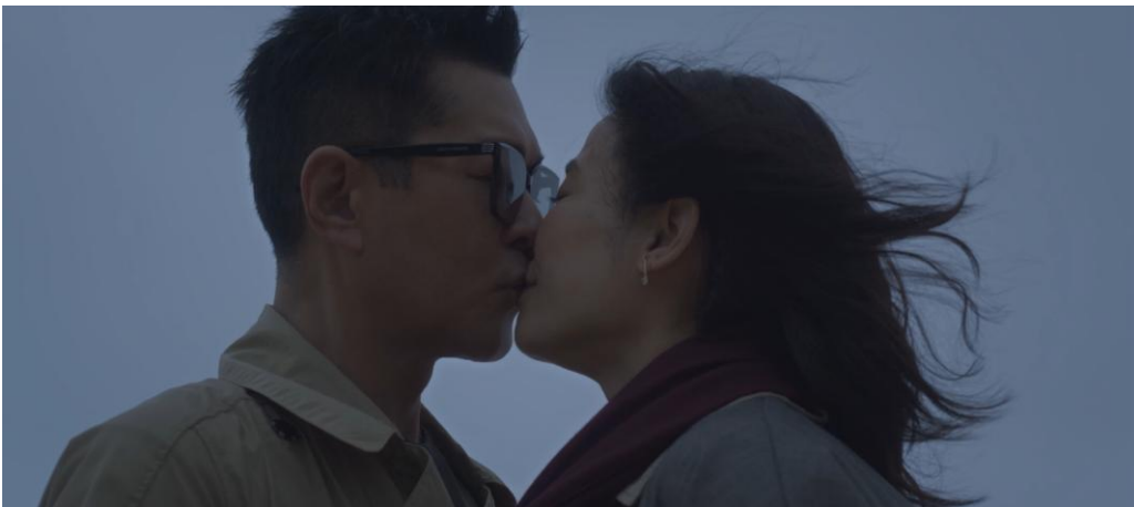
標題：古天樂及宣萱更上演粉絲多年「最期待畫面」，於《無時空之戀》MV內甜蜜相擁錫錫，呈獻最Sweet的完美結局，一圓粉絲夢。