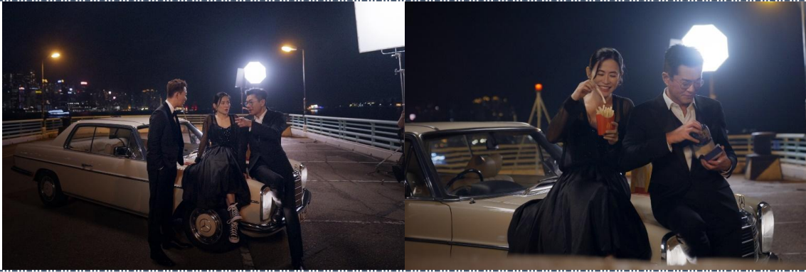
標題：古天樂、宣萱及與客串登場的林峯默契十足，三人拍攝期間不時互相整蠱對方，令現場充滿歡樂氣氛。